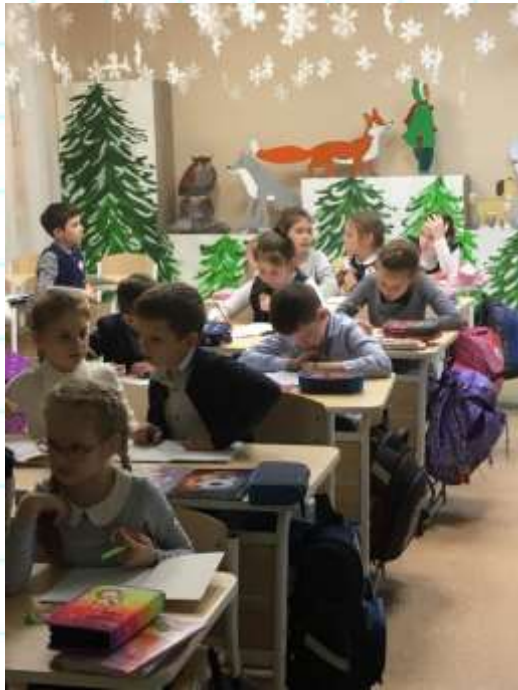
«Учимся писать письма»